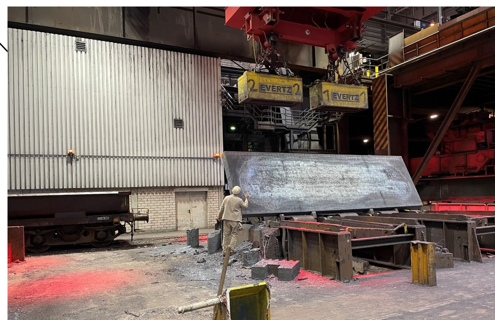
Gefährdungen & Belastungen