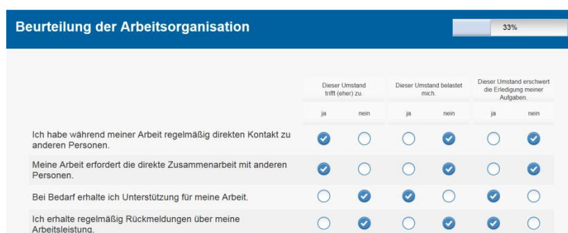
Abbildung 4: Systematik des BAAM ® Verfahrens (Auszug aus der Instruktion der Online-Befragung).

In Unternehmen E kam das BAAM ® Verfahren in seiner Onlineversion zum Einsatz. Dieses wurde von BIT 1998 im Rahmen eines Forschungsprojektes entwickelt und ist seitdem in über 150 Unternehmen unterschiedlichster Branchen erfolgreich angewendet worden.